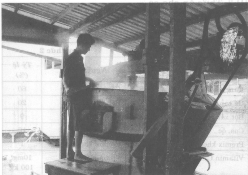
Hình 1: Lò nấu thức ăn tự chế biến

- Thức ăn viên công nghiệp (TACN) : Do các nhà máy sản xuất thức ăn công nghiệp cung cấp, có cả dạng chìm và nổi. Hiện nay có rất nhiều hãng sản xuất thức ăn công nghiệp nên người nuôi có thể dễ dàng lựa chọn loại nào ưa thích và phù hợp. Thức ăn viên công nghiệp và thức ăn tự chế biến đều không được chứa các loại hóa chất hoặc kháng sinh đã bị cấm.