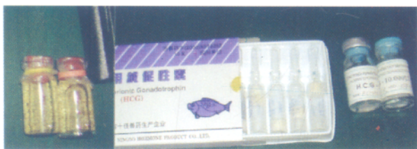
Các loại kích dục tố cho cá