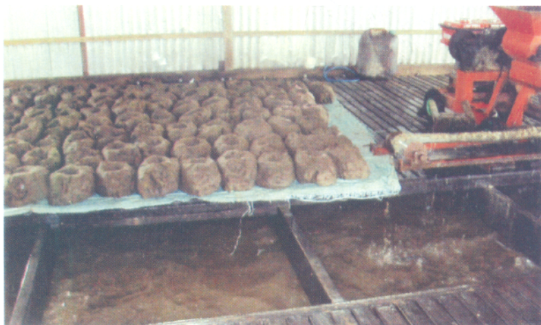
Thức ăn tạt chế biến sau khi nấu chín