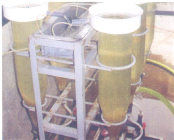
Ấp trứng trong bình vôi