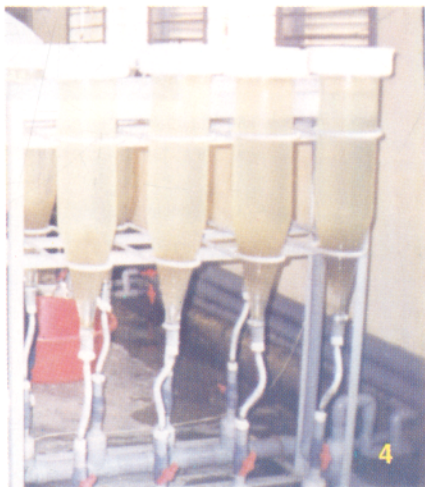
Các loại bể ấp trứng cá 1-Bể vòng xi măng; 2-Bể chữ nhật xi măng; 3-Bể composite, 4-Bình vôi