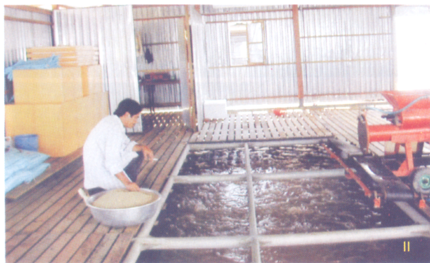
Cho cá ăn trong ao (I) và trong bè (II)