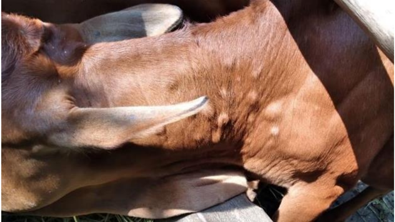
Bò mới bị bệnh, u cục rải rác