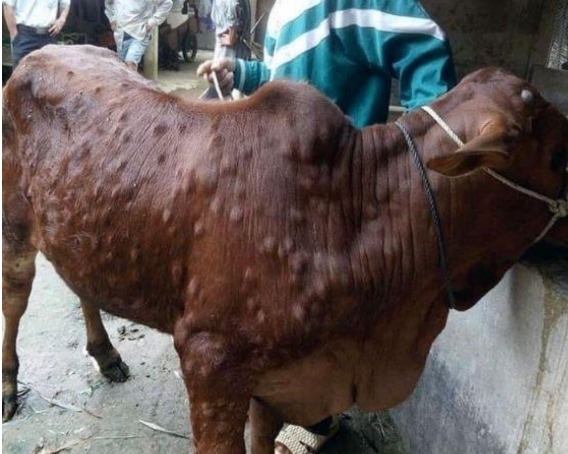
Bò bị bệnh nặng, u cục toàn thân