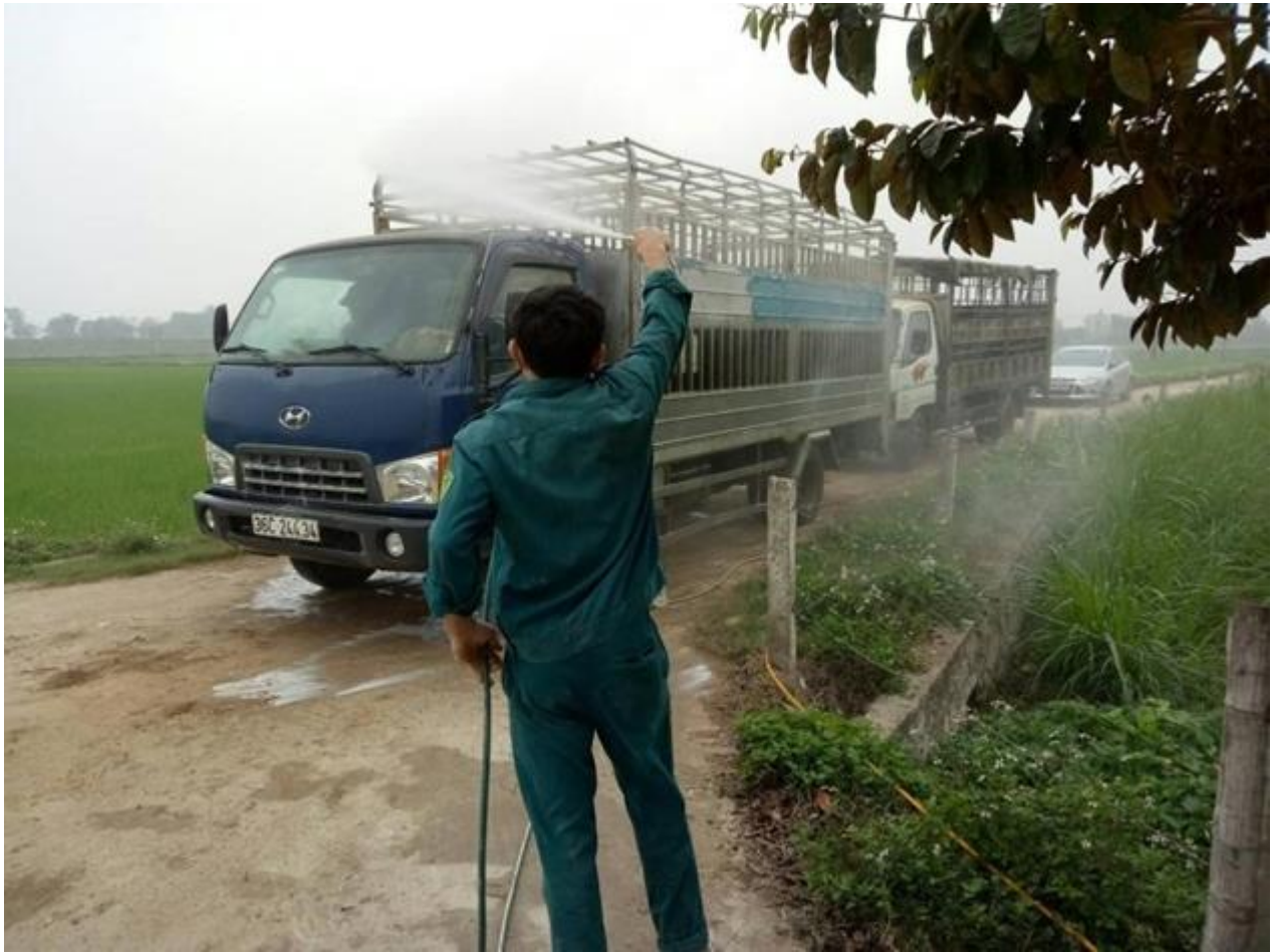
Thực hiện kiểm soát vệ sinh an toàn vệ sinh nghiêm ngặt